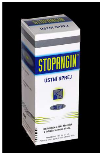
Kurzy ZZA Perla